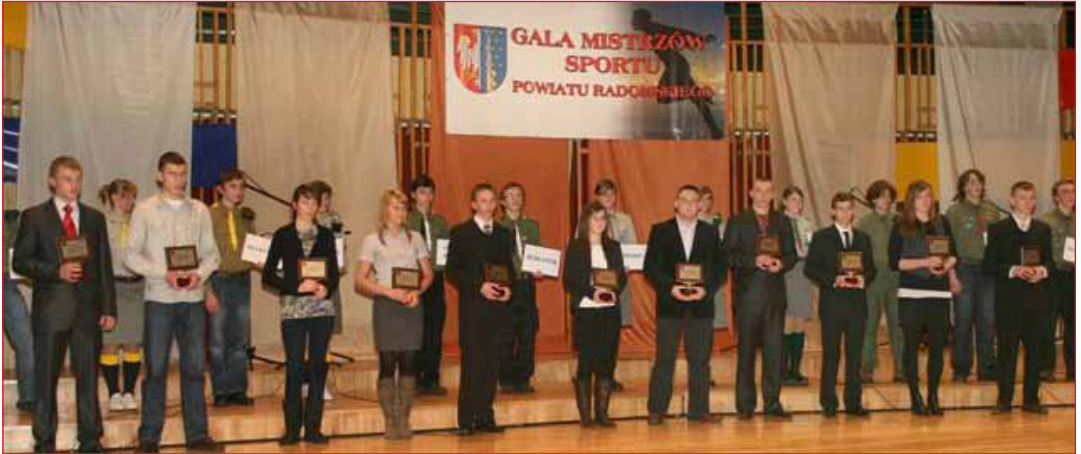
Nagrodzeni sportowcy rocznik 1994 i starsi.