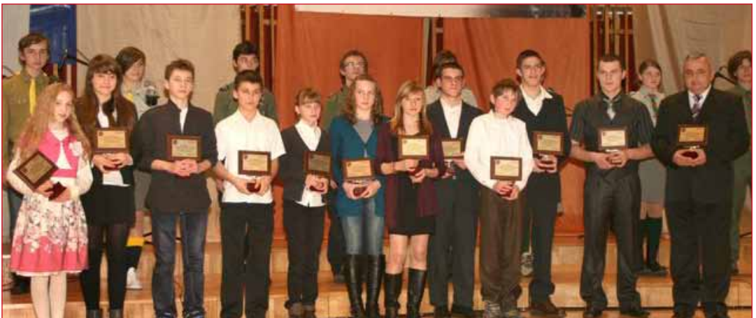
Nagrodzeni sportowcy rocznik 1995 i młodsi.